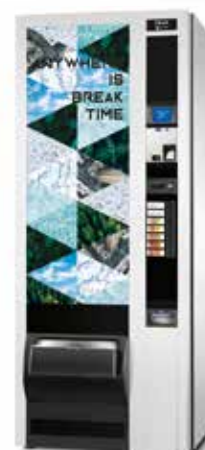
Modello Diesis 500