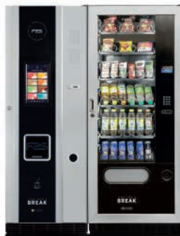
FAS 500 T + Young 183