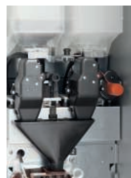
Regolazione automatica della macinatura su caffè top