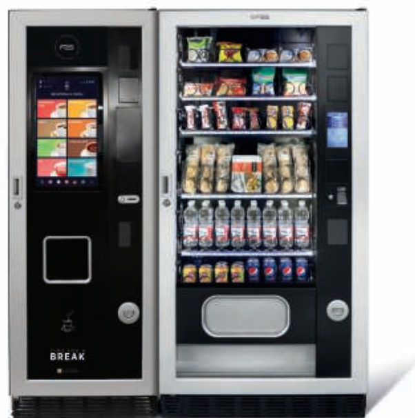
Winning T + Faster TMT