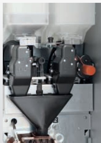
Regolazione automatica della macinatura su caffè top